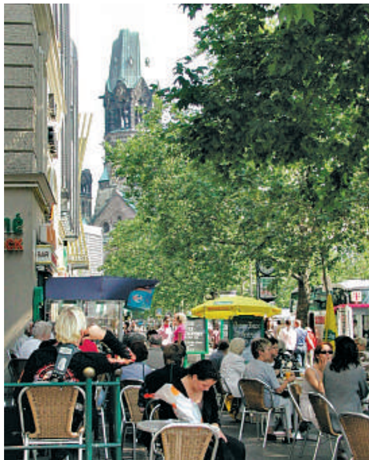
Kurfürstendamm. Elegante moteforretninger, men også et sted man kan sette seg ned for for en forfriskning og se og bli sett.