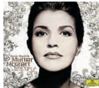
Deutsche Grammophon og Anne Sophie Mutter. Verdenskjent og Norgeskjent, Mutter ikke minst på grunn av sitt samarbeid med Trondhjemsolistene.