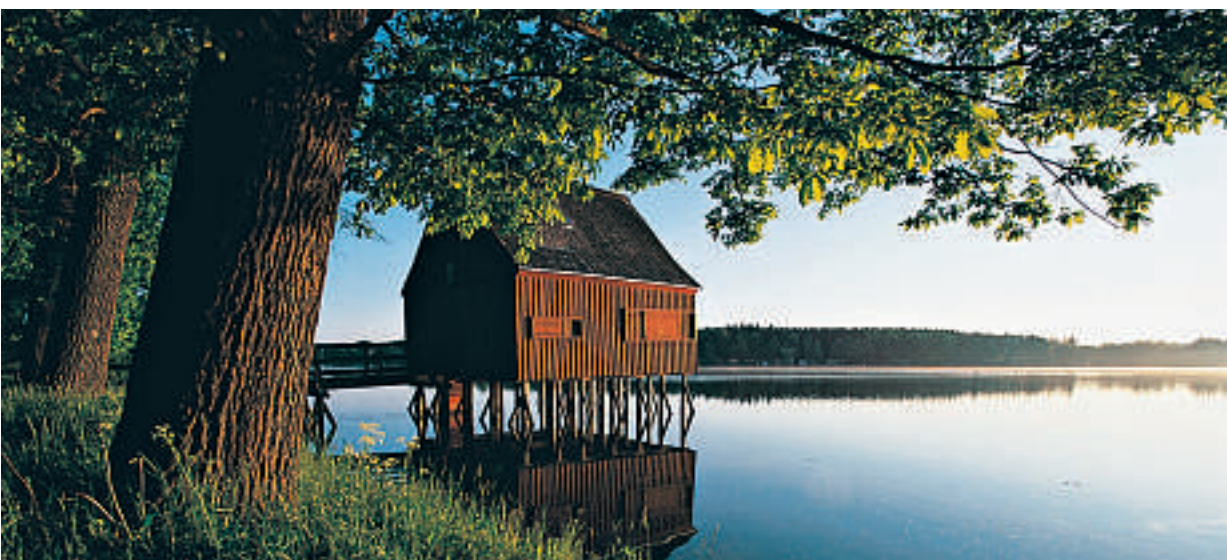
Det milde landskap. Thüringer Wald er et område som innbyr til aktiviteter. Store skoger, hyggelige landsbyer og store og små vann. Flott for padleturer, ideelt for vandre- og sykkelture. Det grønne Tyskland er undervurdert av nordmenn.

Besøk Schmalkalden med alle bindingsverkhuisene og Bad Liebenstein med kurbadbygningene – for selve badene og for velværes skyld. Og den fantastiske Marienglashöhle-grotten. Thüringen er stedet for både kultur og natur.