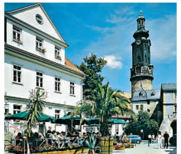
En kald forfriskning i historiske omgivelser? Det er det lett å få til i Thüringen. Og ved å se disse gamle husene fra forskjellige epoker skjønner du også mye av Thüringens historie.