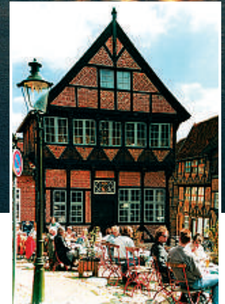
Det er ikke langt mellom hvert bindingsverkshus i Schleswig-Holstein. Altstadt.