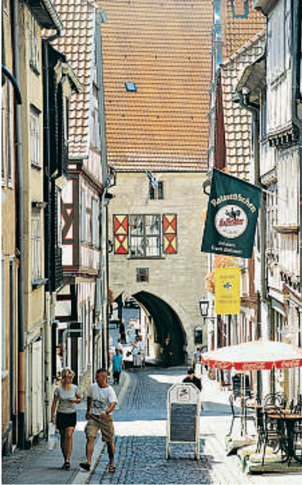
Gamle bindingsverkhuis, brolagte gater, bilfrie byområder. Det er både lett og hyggelig å være i Thüringens gamle og vakre middelalderbyer.

Midt i Tyskland. Kultur og natur. Goethe og Schiller skrev mange av sine mesterverk her, Johan Sebastian Bach ble født her, og den ungarske komponisten Franz Liszt grunnla en musikksskole her. Kultur og natur – det er Thüringen.