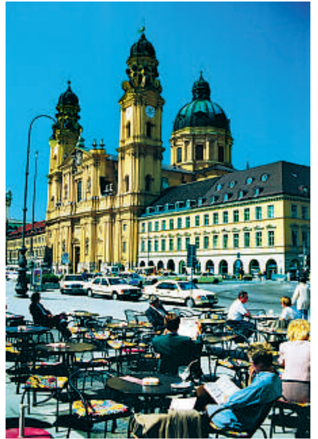
Fortauskafé i München med Theatinekirken i bakgrunnen.