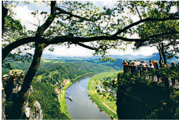
Sachsens Sveits. Det var et navn sveitsiske kunstmalerne satte på dette området. Her flott utstikt fra fjellet Bastei.

www.visitsaxony.com www.sachsen-tour.de www.leipzig.de www.grassmuseum.de