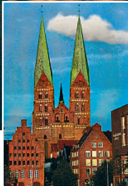
St. Marienkirken i Lübeck og vakker, tradisjonell teglsteinbebyggelse.