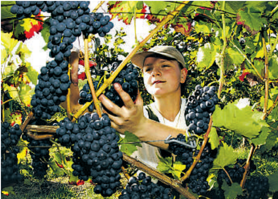
Innhøsting av druer som brukes til rødvin. Tysk hvitvin er kjent over hele verden. Nå er også tysk rødvin på full fart inn på det internasjonale markedet.