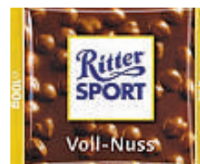
Ritter sjokolade. En suksess, selv i et land med Melkesjokolade og Firkløver.