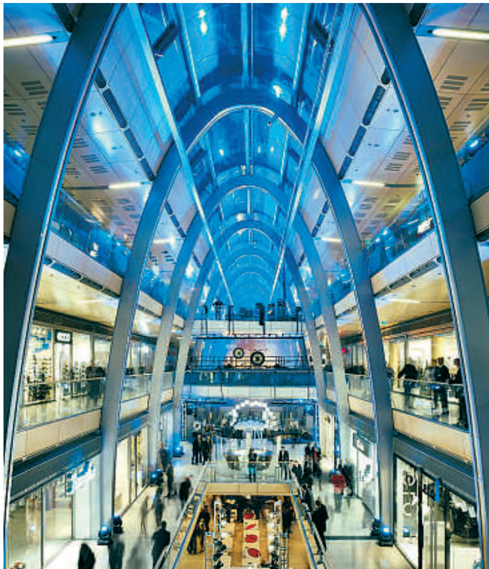
Hamburgs nyeste konsumtempel «Europa-passasjen». Ingen annen europeisk metropol kan tilby så mange eksklusive merker på et så lite område, noe som gjør Hamburg til en magnet for luksusshoppere fra hele verden.