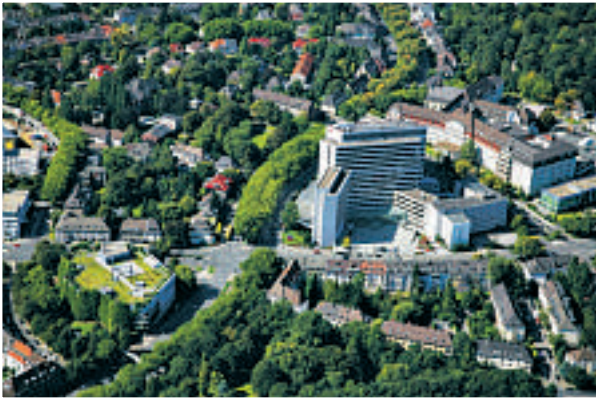
E.ON holder til i Essen i Tyskland.