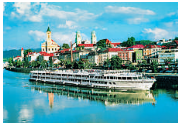
Sakte reise: Cruisebåt, med byen Passau i bakgrunnen.