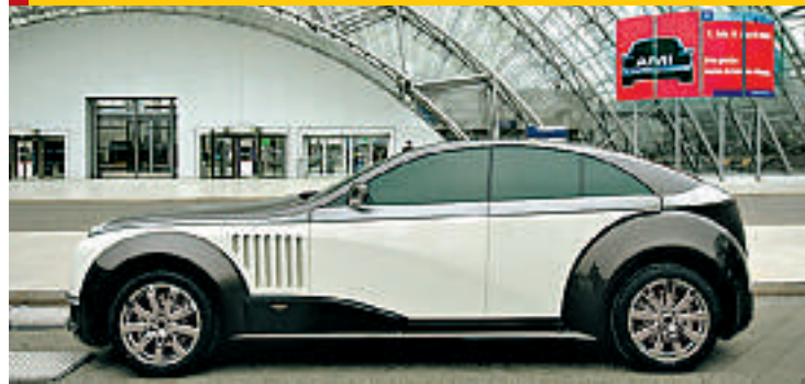
Blanke og nye biler på AutoMobil i Leipzig i april.

14.-22.4: AutoMobil i Leipzig. Stor og viktig bilmesse. www.ami-leipzig.de