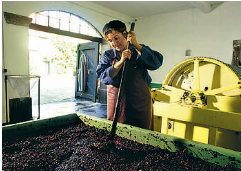
Vinproduksjonen er for en stor del mekanisert, men mange vinbønder utfører fremdeles enkelte arbeidsoperasjoner slik de har vært gjort i mange hundre år.