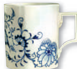
Meissen-porselen. De blåmønstrede motivene er både vakre og eksklusive.