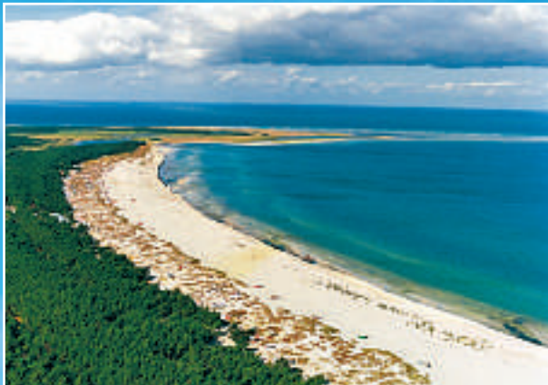
Mecklenburg-Vorpommern har hele 170 mil med kystlinje til Østersjøen. Her ved Fischland-Darß-Zingst.