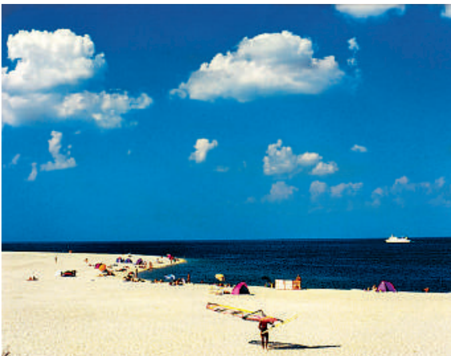
Øya Sylt er et av de store feriemålene om sommeren. Sol, sand og sjø.