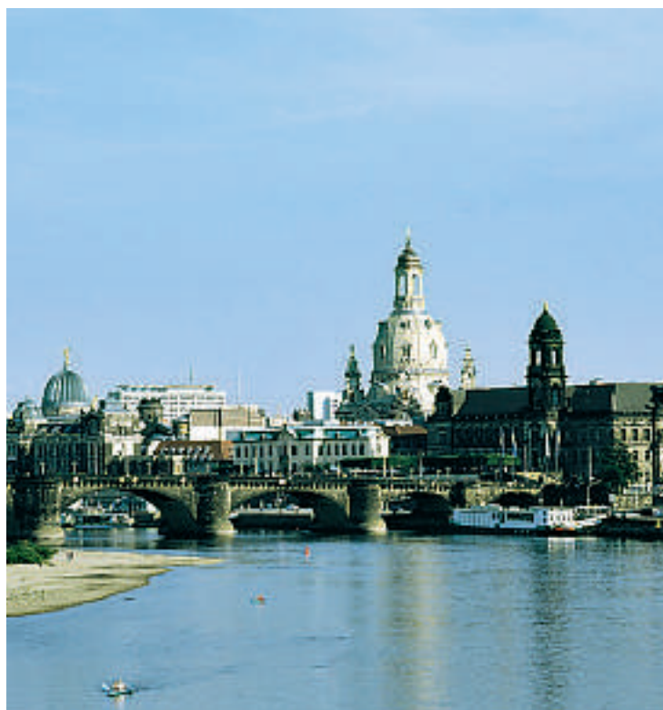
Få byer kan oppvise en så flott samling av gamle dampskip som Dresden. Her fra den årlige båtparaden på elven Elbe.