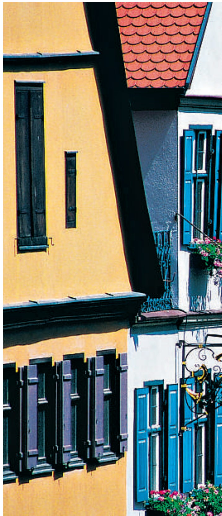
Fargerike fasader i Dinkelsbühl.

www.allgaeu.info www.frankentourismus.de www.ostbayern-tourismus.de www.romantischestrassen.de