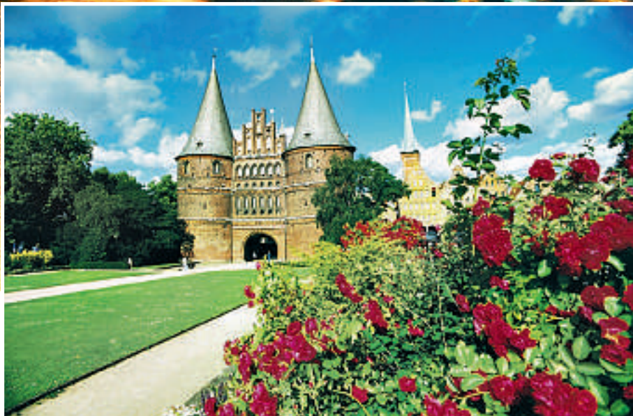
Holstentor – Landemerke i Østersjøbyen.