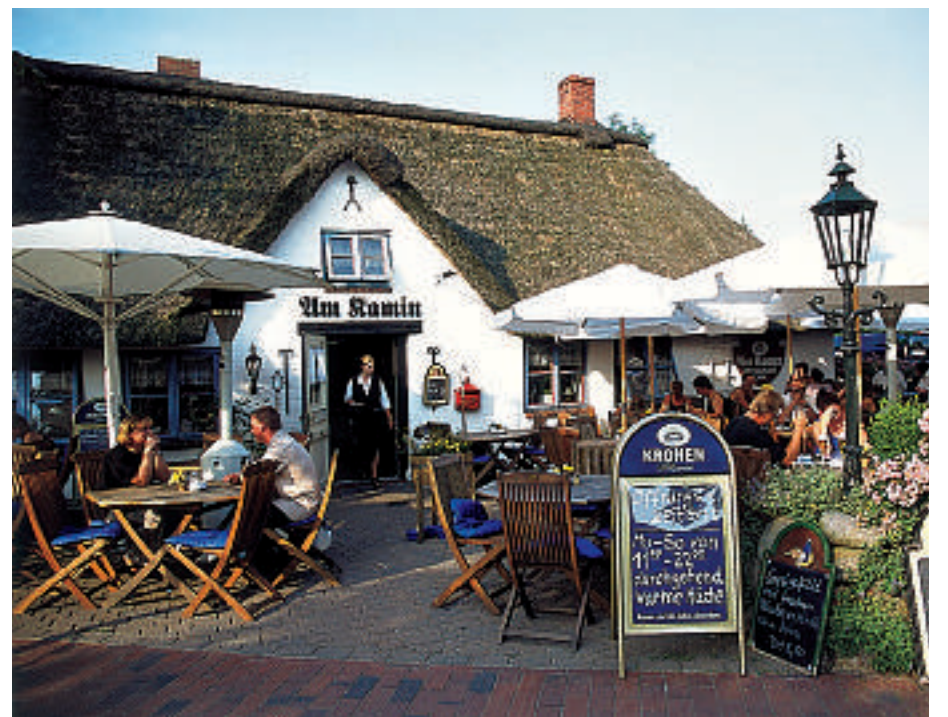
Tysk «gemütlichkeit». Her ved i kafé i St. Peter-Ording ved Nordsjøkysten.