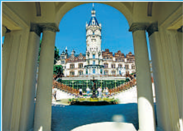
Det mektige slottet i delstatshovedstaden Schwerin ligger idyllisk til ved en av de mange innsjøene i dette området.