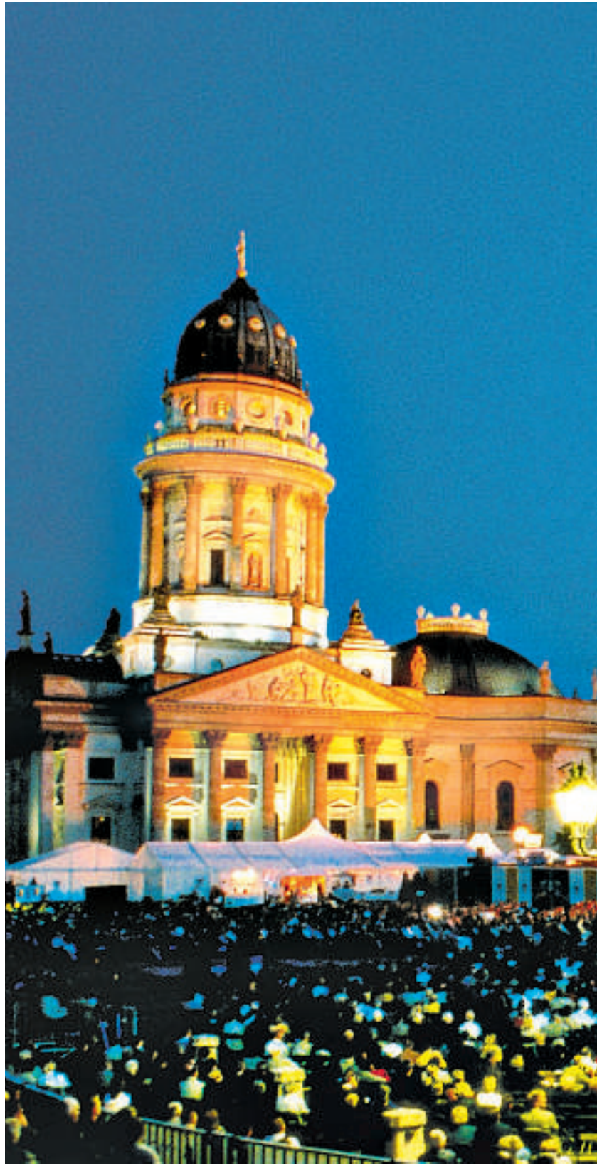
Gendarmenmarkt er en plass beliggende i den sentrale bydelen Mitte i Berlin. Her ligger arkitekten Karl Friedrich Schinkels Königliches Schauspielhaus, som brukes som konsert-

30.6-31.7: Operafestspiele i München. Det beste av det beste fra inn og utland. www.muenchner-opernfestspiele.de