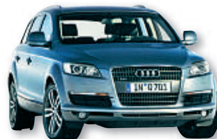
Tyske kvalitetsbiler. Audi er en av dem som har slått godt an i Norge.