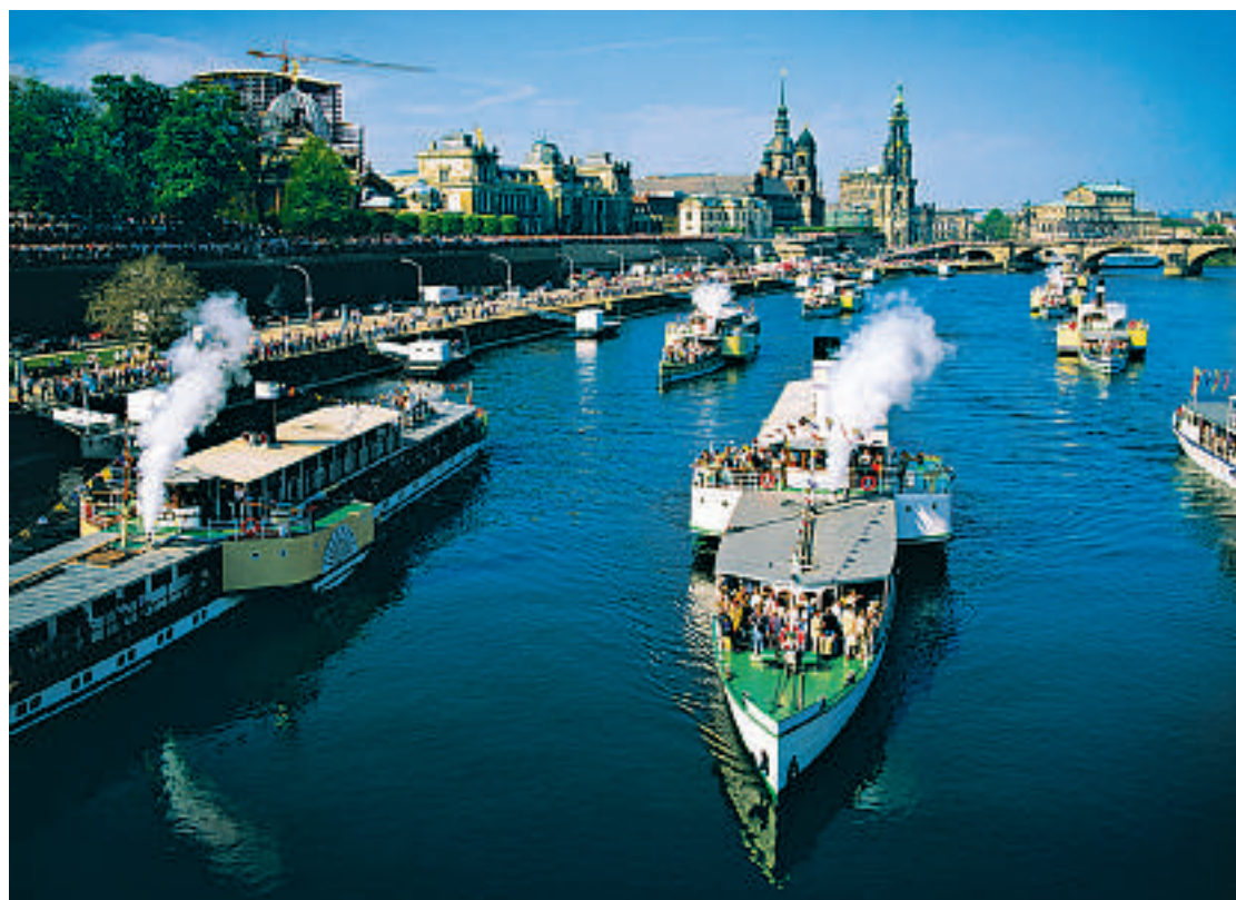
Byen er elven, og elven er byen. Dresden og Elbe – som hånd i hanske.

Dette er et høyt verdsatt fotturområde, men du kan også se mye av landskapet fra båt på Elbe. Villest er det på Bastei, noen merkelige fjellformasjoner forbundet med broer og med en utrolig utsikt.