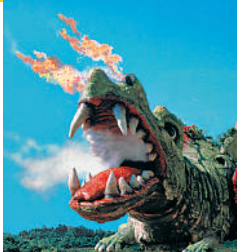
Fra «Drep en drage-festivalen» i Furth im Wald, Bayern.

7.-9.9: International Vintage Aircraft Meeting. Herlige gamle fly, på bakken og i luften. Kirchheim unter Teck, Baden-Württemberg. www.kirchheim-teck.de