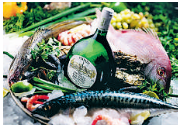
Lokale råvarer: Fisk med lokal Frankenvin.