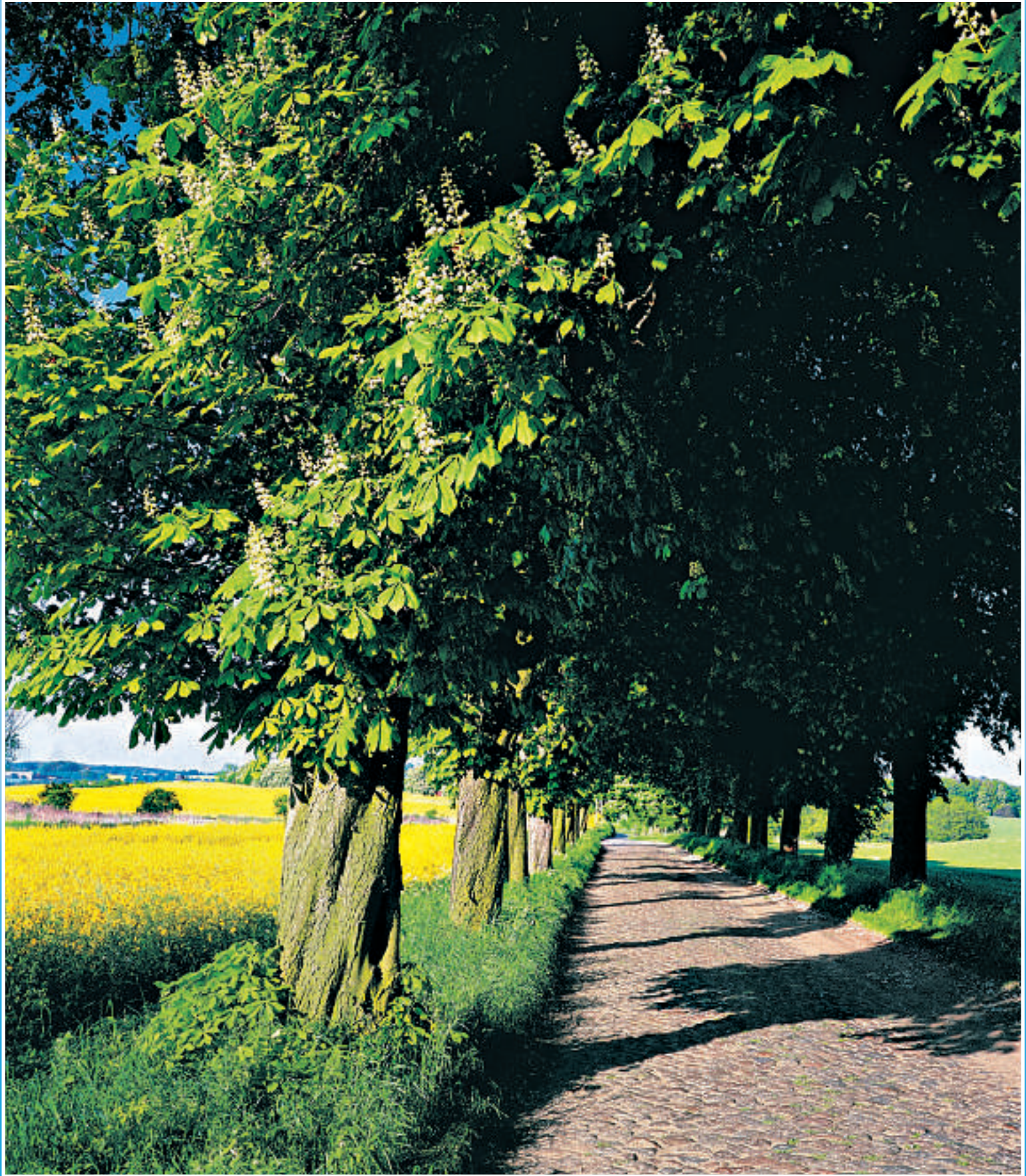
Lange alleer, brolagte veier, bølgende åkre – det er sommer i Mecklenburg-Vorpommern.

Hovedside: www.auf-nach-mv.de Schwerin: www.schwerin.de Golf: www.golfverband-mv.de Turistkontor: www.discover-mv.de Wismar: www.wismar.de Stralsund: www.stralsund.de Rügen: www.ruegen.de