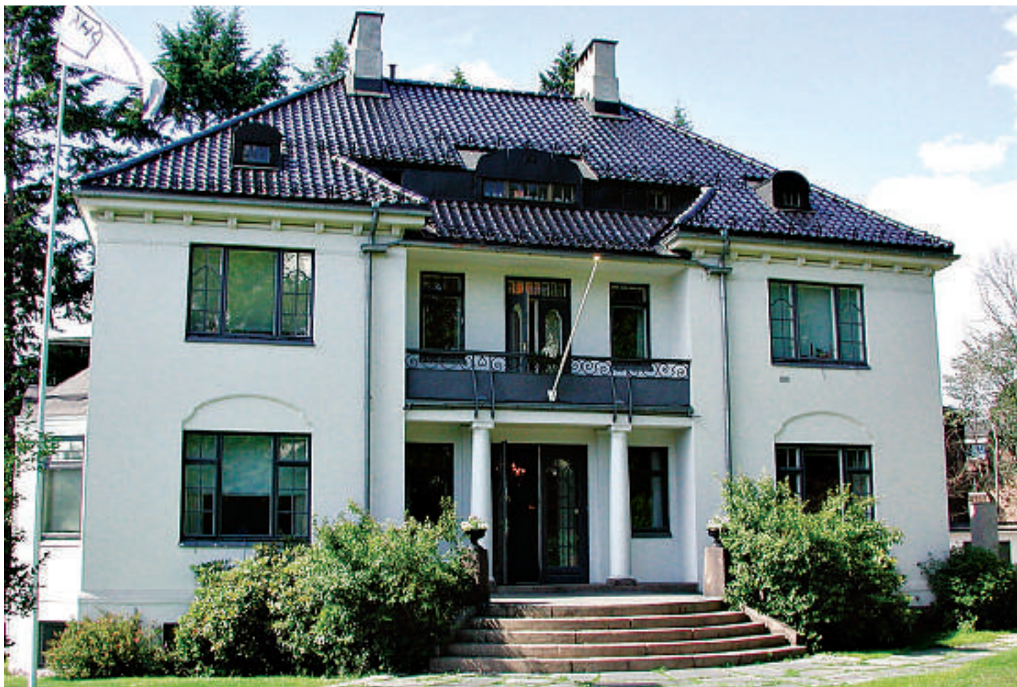
Norsk-Tysk Handelskammer i Oslo innehar Norges største ekspertise på det tyske markedet. Handelskammeret representerer en rekke av Tysklands største messer og bistår norske bedrifter med blant annet markedsrådgivning og juridisk kompetanse.

Av de tjenestene Handelskammeret tilbyr oppleves en økt etterspørsel spesielt innen markedsrådgivning og juridisk assistanse. Innen markedsrådgivning er det utforming av inngangs-