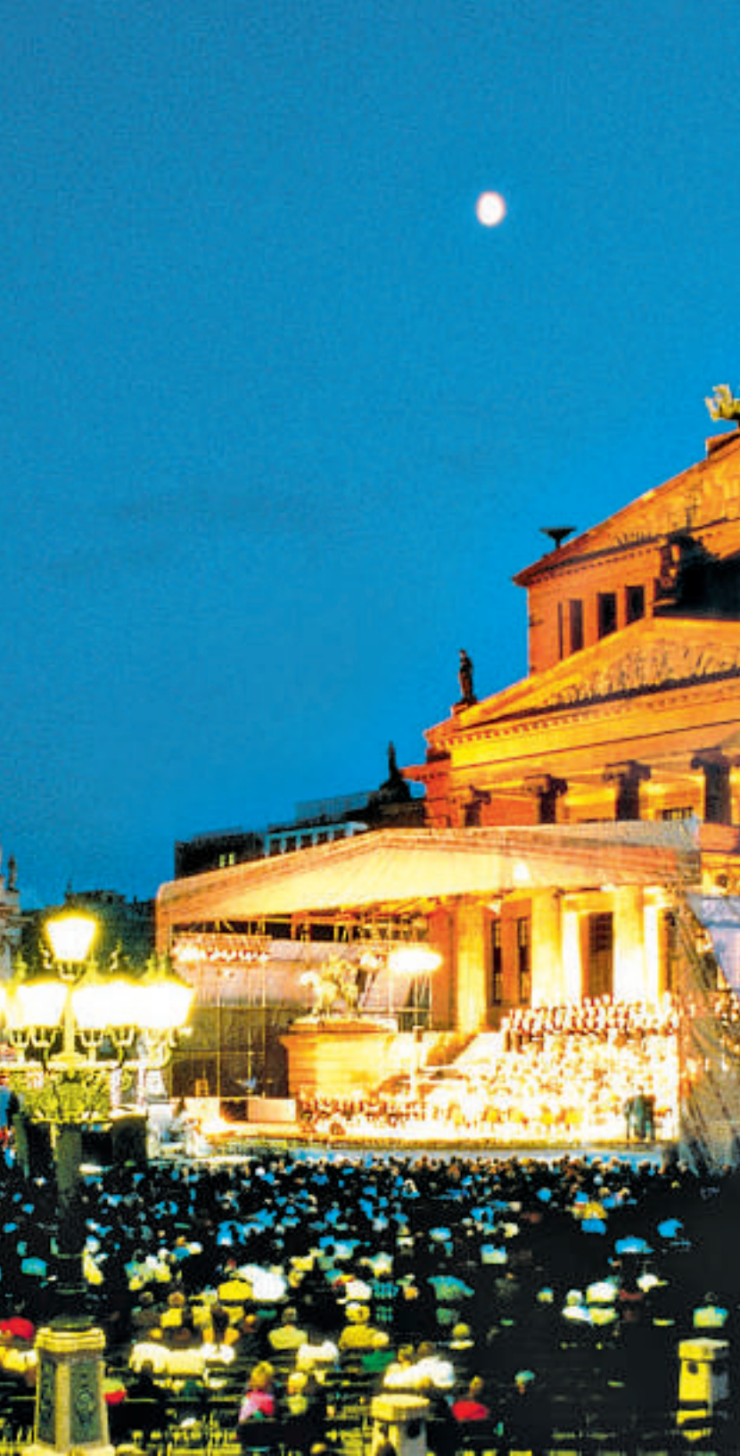
Französischer Dom (den franske dom), Deutscher Dom (den tyske dom) og hus (Konzerthaus Berlin).

SJEKK BL.A. WWW.TYSKLAND-INFO.COM OG WWW.DEUTSCHLAND-TOURISMUS.DE FOR MER INFORMASJON.