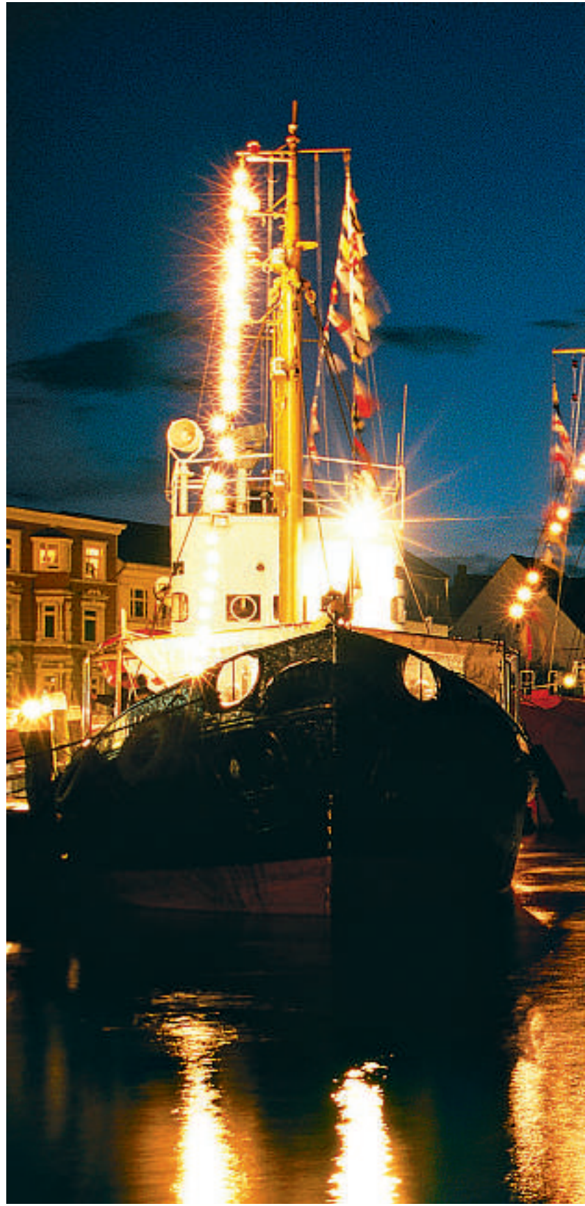
Nattstemning ved havnen i Flensburg.

Westerland er selve hjertet på øya Sylt. Her, og på hele øya, er aktivitetensnivået høyt, særlig i sommermånedene. Da er det strandparties, friluftskonserter og matfestivaler. Men det først og fremst de lange sandstrendene som trekker, med sanddynene, opptil 25 meter høye. Og alle mulige typer vannsport og seiling, jogging og forskjellige fitness-aktiviteter.