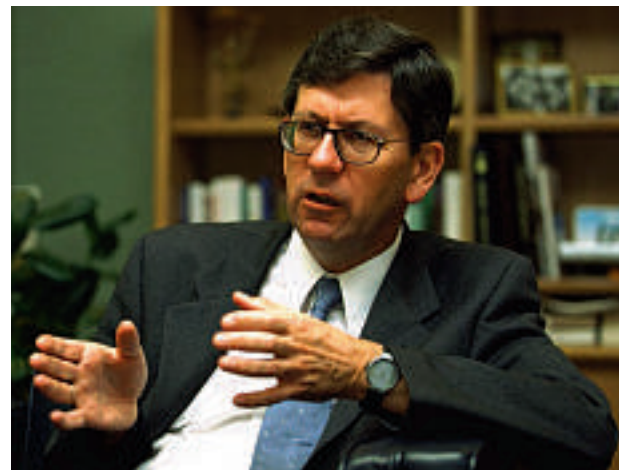
Bjørn Tore Godal, Norges ambassadør i Tyskland.