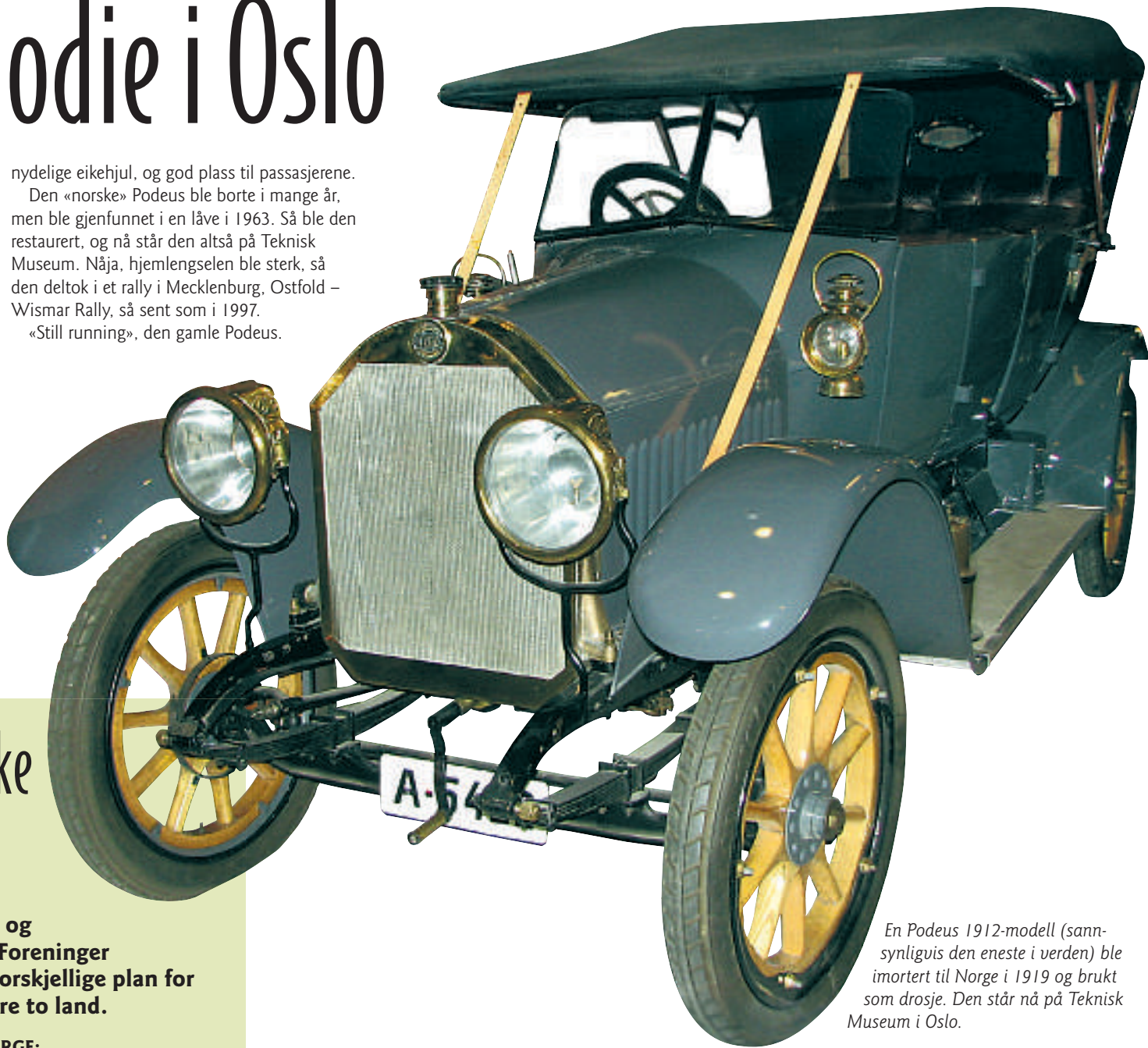
En Podeus 1912-modell (sannsynligvis den eneste i verden) ble importert til Norge i 1919 og brukt som drosje. Den står nå på Teknisk Museum i Oslo.