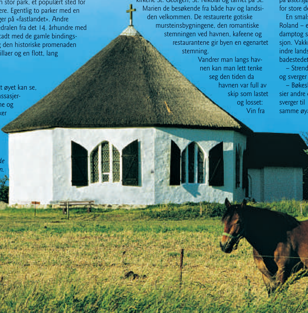
Enkel og vakker: Den åttekantede Vittekirken på Rügen.

– Strender, sier noen, og sverger til Rügen. – Bøskogene, sier andre og sverger til samme øya.