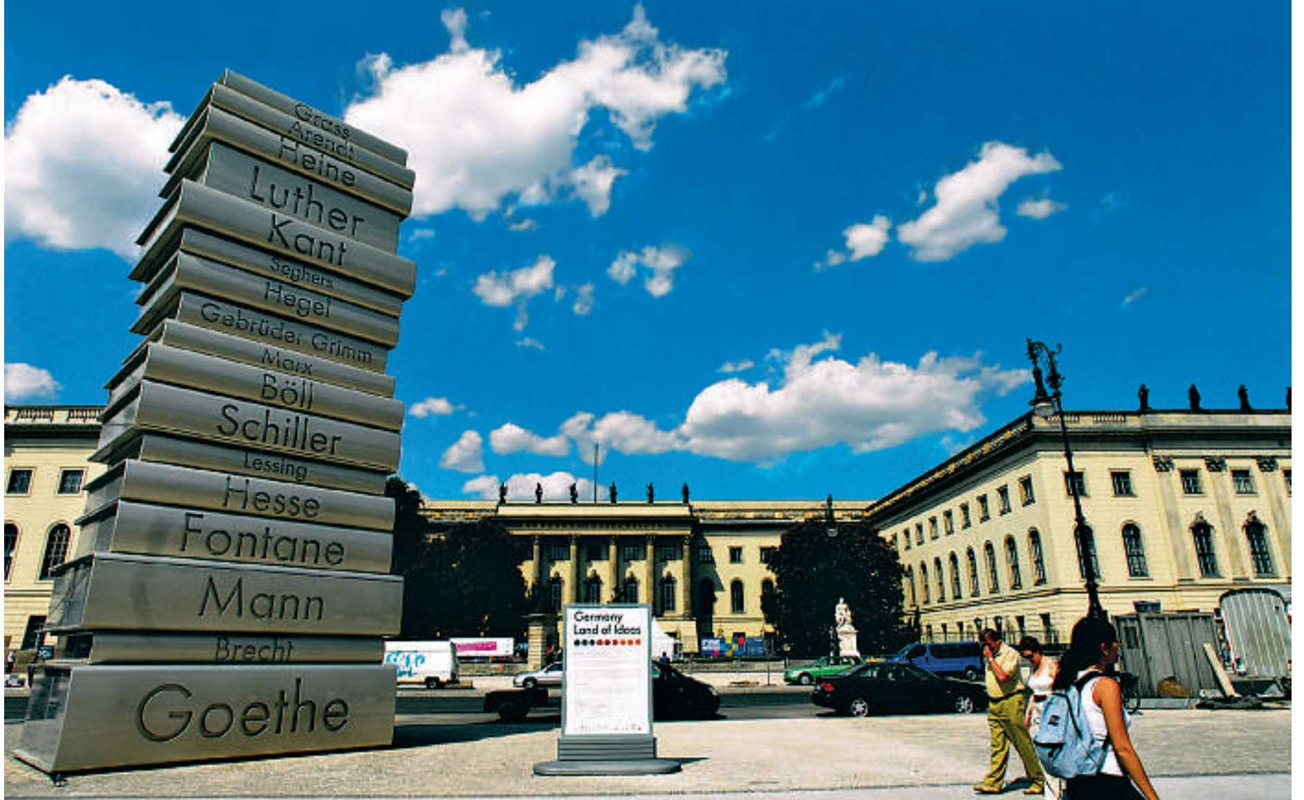
På denne plassen foran Humboldt-universitetet ble det i 1933 brent bøker skrevet av jøder og andre som Hitler-regimet ikke likte.

Humboldt-universitetet i Berlin er kjent som «alle moderne universiteters mor». Det ble grunnlagt på ideen om enhet mellom forskning og læring – en tanke som også ble grunnleggende for Universitetet i Oslo.