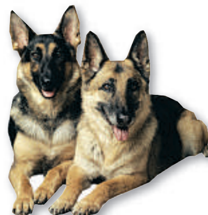
Tysk adel på fire ben. Schäferhunden er Norges mest populære hundrase.