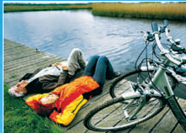
Innsjøer, kanaler, elver? Mecklenburg-Vorpommern er et eneste stort friluftparadis. Ikke minst egnet for å sykle.