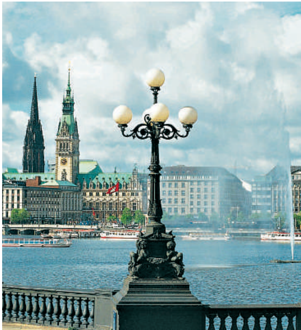
Like bak den store innsjøen Binnenalster ligger det mektige rådhuset som i over hundre år har vært sete til Fylkestinget og Senatet. Til venstre Nikolaikirken som ble ødelagt under annen verdenskrig. Kun det svarte kirketårnet står igjen som et minnesmerke.