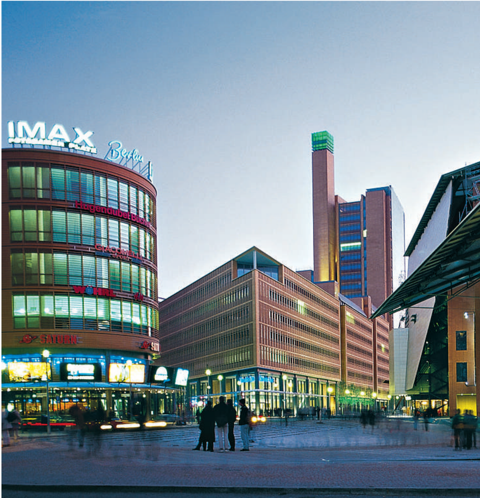
Supermoderne! Berlin er også en by for alle dem som vil studere moderne arkitektur. Området rundt Alexanderplatz er ikke minst tilholdssted for de yngre generasjoner.

Berlin er en by som har noe å tilby alle. Det skyldes at dagens Berlin – på godt og vondt – gjen-speiler landets historie. Byen har vært utsatt for noen av de største ødeleggelsene en by har gjennomgått i nyere tid.