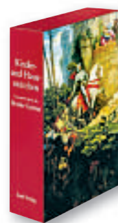
Brødrene Grimms eventyr. Kontakt med Tyskland allerede som barn.

Sa jeg de? Vi også, for det er det beste, de deler med oss!