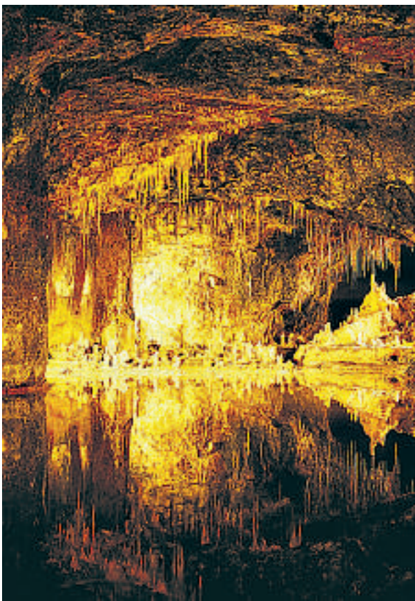
Thüringen har flere store dryppsteinsgrotter med Marienglashöhe som den mest kjente. Trollsk belysning, vann så blankt som speil? en magisk stemning.

Det er et godt kallenavn, for denne delstaten har store landskapsområder som er dekket av tett skog, her kan de besøkende vandre eller sykle på merkede stier. Thüringens sjarmerende landsbyer og byer som også har mye å tilby deg som er interessert i kunst og historie.