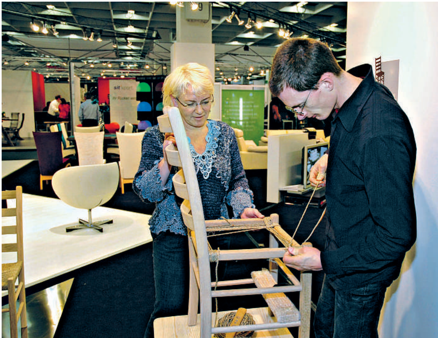
Norske møbler på tysk messe: Her vises det hvordan setet tres på en tradisjonell, norsk jærstol.